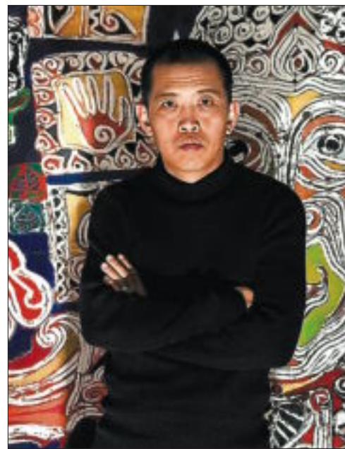
Htein Lin.

La mostra porta per títol Missing Asia, observing Europa ( Enyorant Àsia, observant Europa ) i el contrast és el més interessant. A la sèrie dedicada a ciutats europees, l'artista inclou de manera quasi bé caòtica tot tipus d'icones representatives del lloc, com la Sagrada Família a Barcelona o els canals a Amsterdam. L'acumulació de personatges, monuments, fragments d'obres dels artistes més representatius o elements simbòlics del lloc sembla al principi una mica naïf, però mirat tot a poc a poc, aquesta acumulació acaba interrogant-nos sobre el que som realment. I, en totes, hi apareix sempre una figura que poc té a veure amb Occident. Es tracta d'un petit Buda que ell col·loca com a senyal d'esperança.