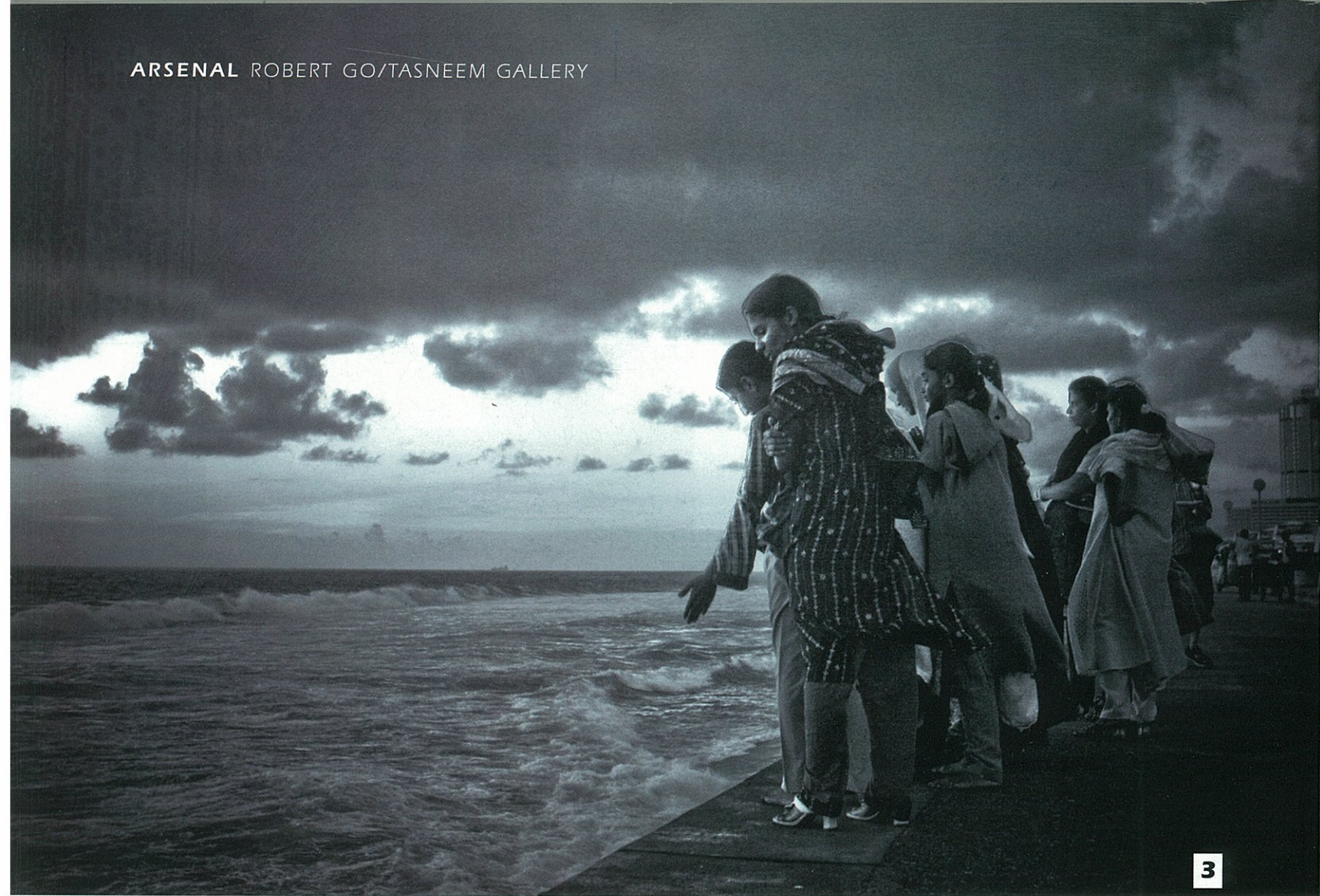
3 A orillas del mar. Todavía persiste el miedo al mar que mato en Sri Lanka, más de 30.000 personas.